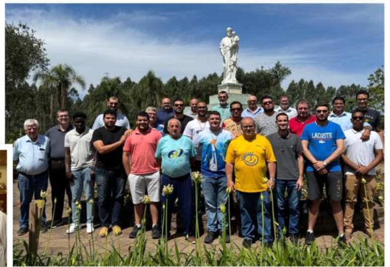
Figura 1: Regional RS