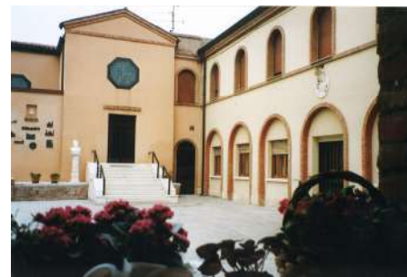
La Casa Madre delle Sorelle PSDP

L' incontro del Consiglio Generale si terrà il giorno 12 Dicembre 2024. Nel pomeriggio dello stesso giorno si terrà nella Casa Madre delle Sorelle di Santa Toscana anche l' incontro fra i due Consigli Generali , per proseguire il cammino di confronto e la condivisione. In particolare, si continuerà a lavorare sulla programmazione dell'Assemblea di Metà Sessennio, che si realizzerà nel Giugno 2025.