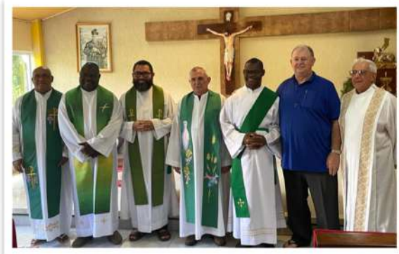
Figura 2: Regional Nordeste

Que a Providência continue abençoando essas comunidades no fortalecimento do Reino de Deus!